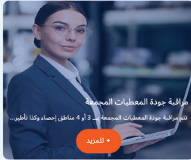
مراقبة جودة المعطيات المجمعة تتم مراقبة جودة المعطيات المجمعة من 3 أو 4 مناطق إحصاء وكذا تطهير...