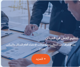
تنظيم العمل في الميدان يتم بإشراف على أشغال جمع بيانات الإحصاء العام للسكان والسكنى 2024.