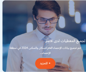
تجميع المعطيات لدى الأسر تتم تجميع بيانات الإحصاء العام للسكان والسكنى 2024 في منطقة الإحصاء...