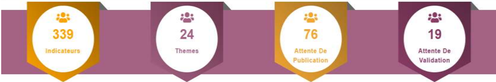
Tableau de bord Indicateurs Référentiel Publication Déconnexion